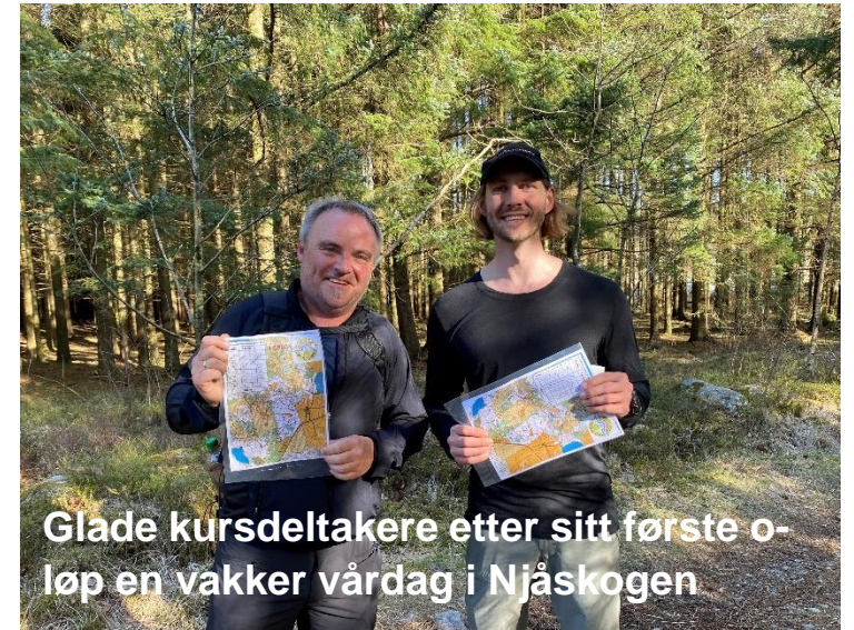
Glade kursdeltakere etter sitt første o-løp en vakker vårdag i Njåskogen